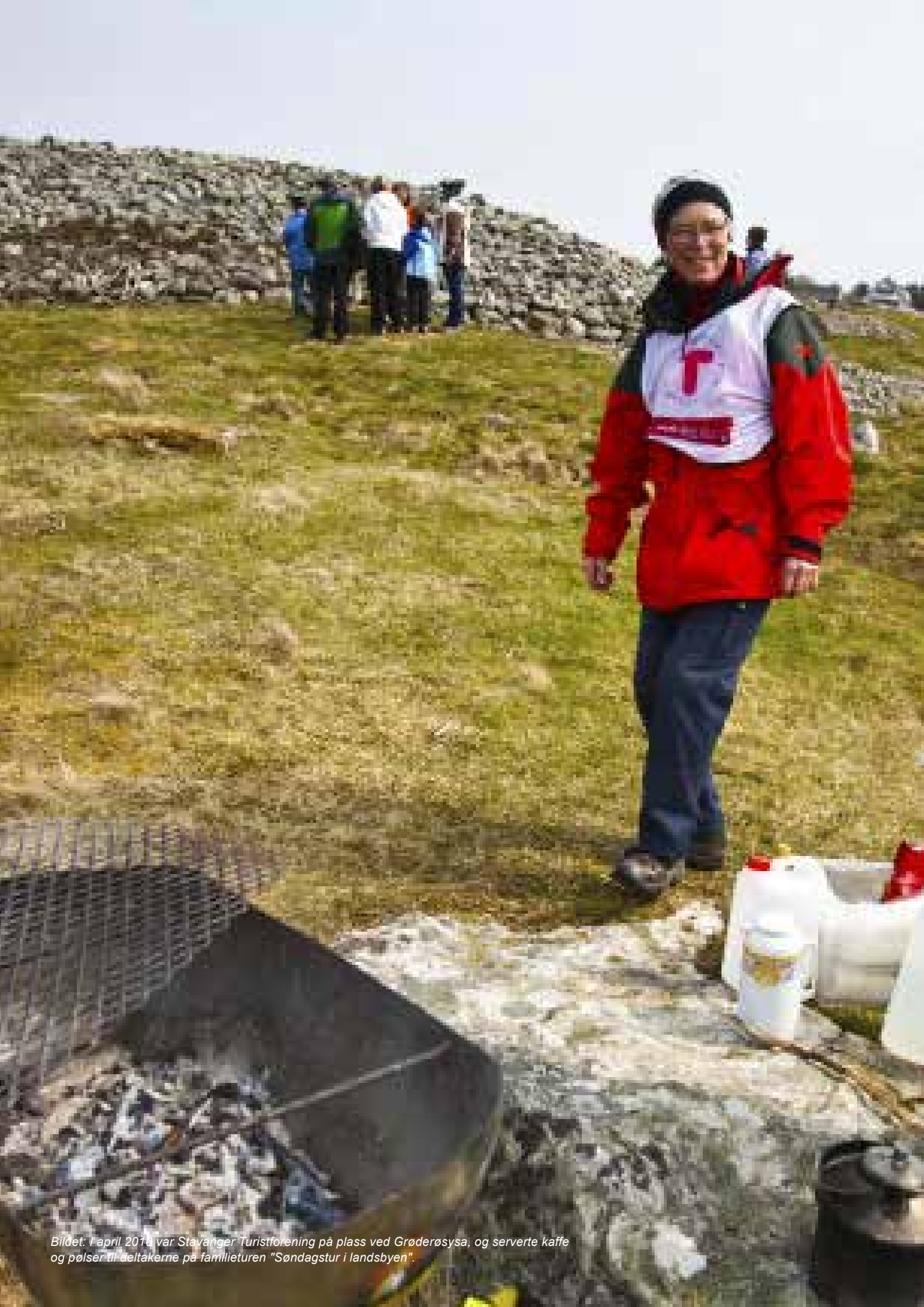
Bildet: I april 2019 var Stavanger Turistforening på plass ved Grøderøsysa, og serverte kaffe og pølser til deltakerne på familieturen "Søndagstur i landsbyen".