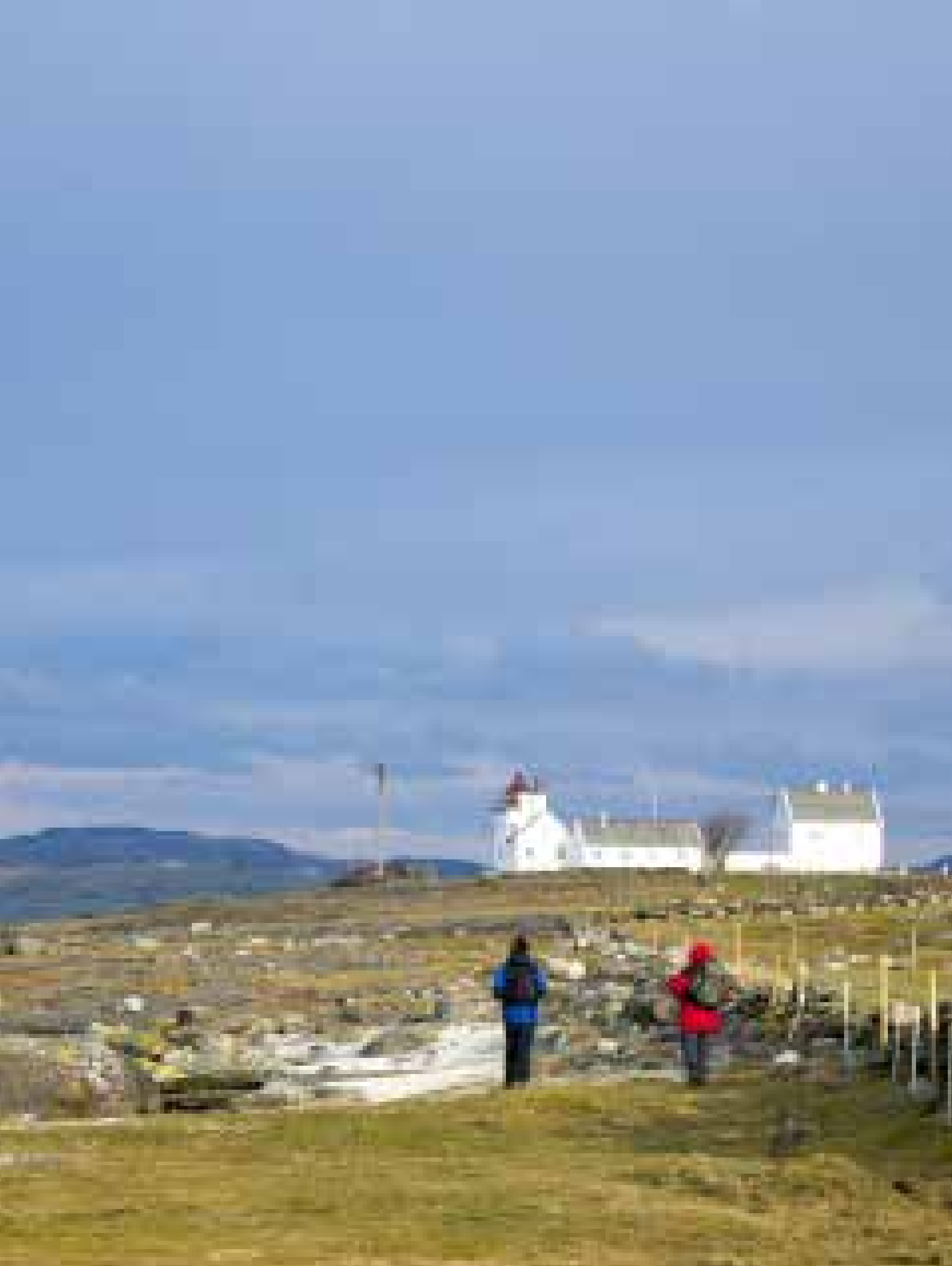
Bildet: På vei mot Tungens fyr fra Holmavika og Holmodden.