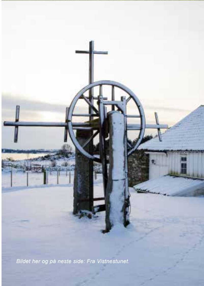
Bildet her og på neste side: Fra Vistnestunet.