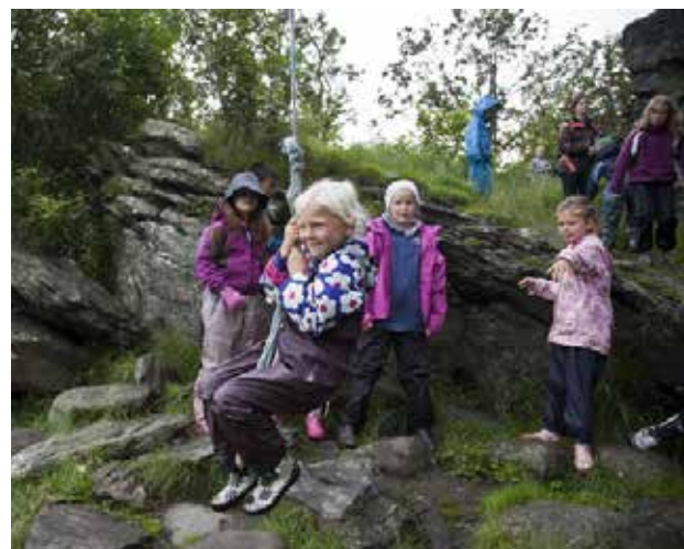
Bildet: Å henge og slenge er en populær aktivitet ved Vistehola. Her besøker Vistnestunet feriekubb hola sommeren 2011.

I databasen Askeladden er det registrert 236 arkeologiske minner.