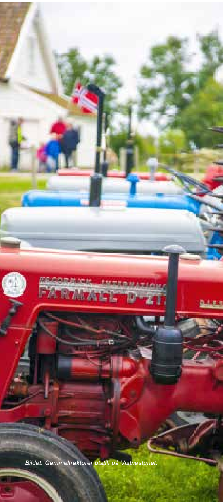
Bildet: Gammeltraktorer utstilt på Vistnestunet.

Stortingsmeldinga dokumenterer at uerstattelige kulturminneverdier er i ferd med å gå tapt og at kulturminner og kulturmiljø ikke blir sett på som en ressurs i samfunnsutviklinga.