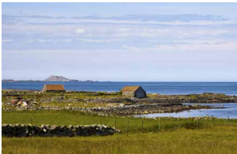
Forsidebildet: Fra Vistehola. Bildet på denne siden: Heianaustet og Trebakknau- tet på Vistnes.