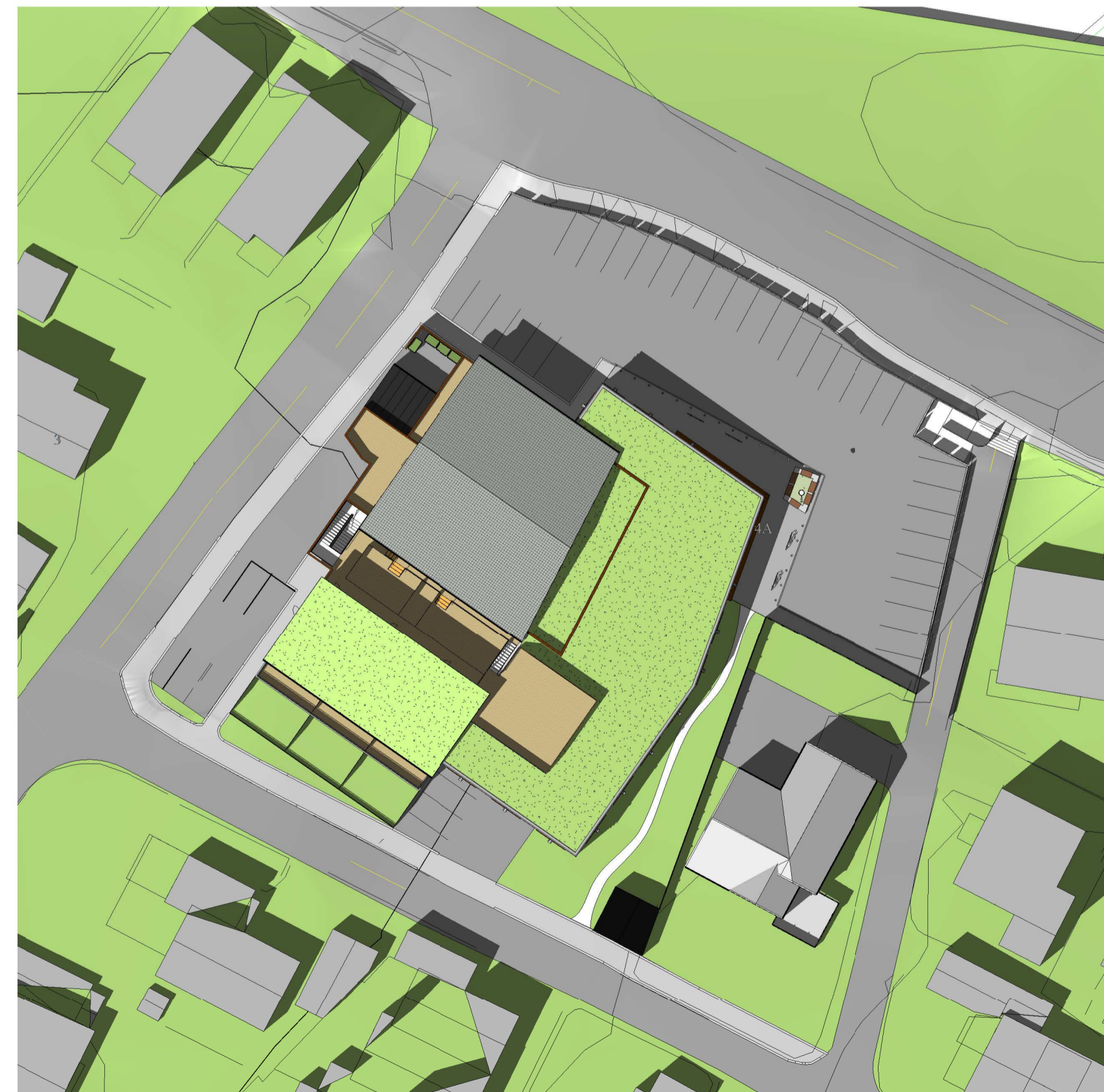
Solstudie - 21. juni kl. 15.00 1 : 500