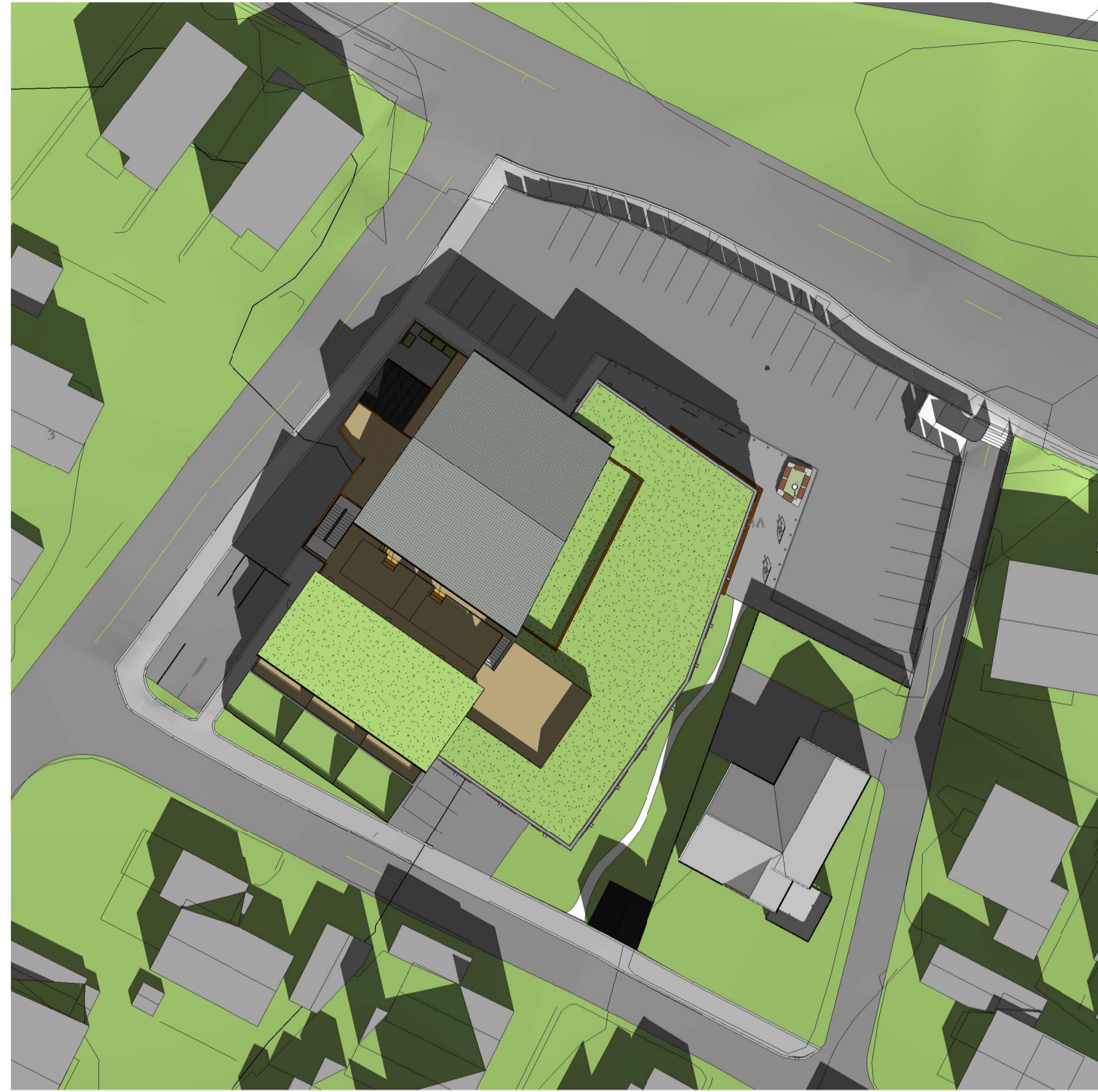
Solstudie - 21. mars kl. 12.00 1 : 500