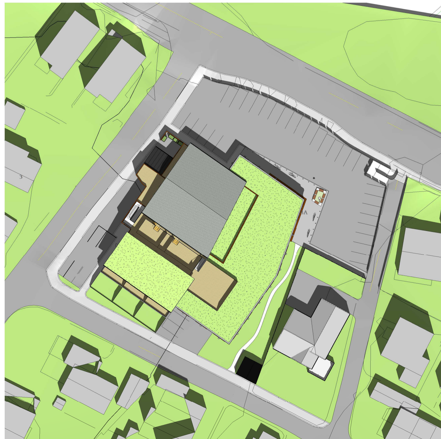
Solstudie - 21. juni kl. 12.00 1 : 500